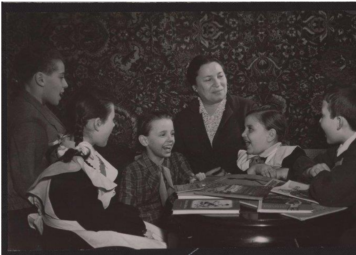
«Агния Барто – любимая поэтесса советских пионеров». Эммануил Евзерихин, 1950-е, МАММ/МДФ, ТАСС.