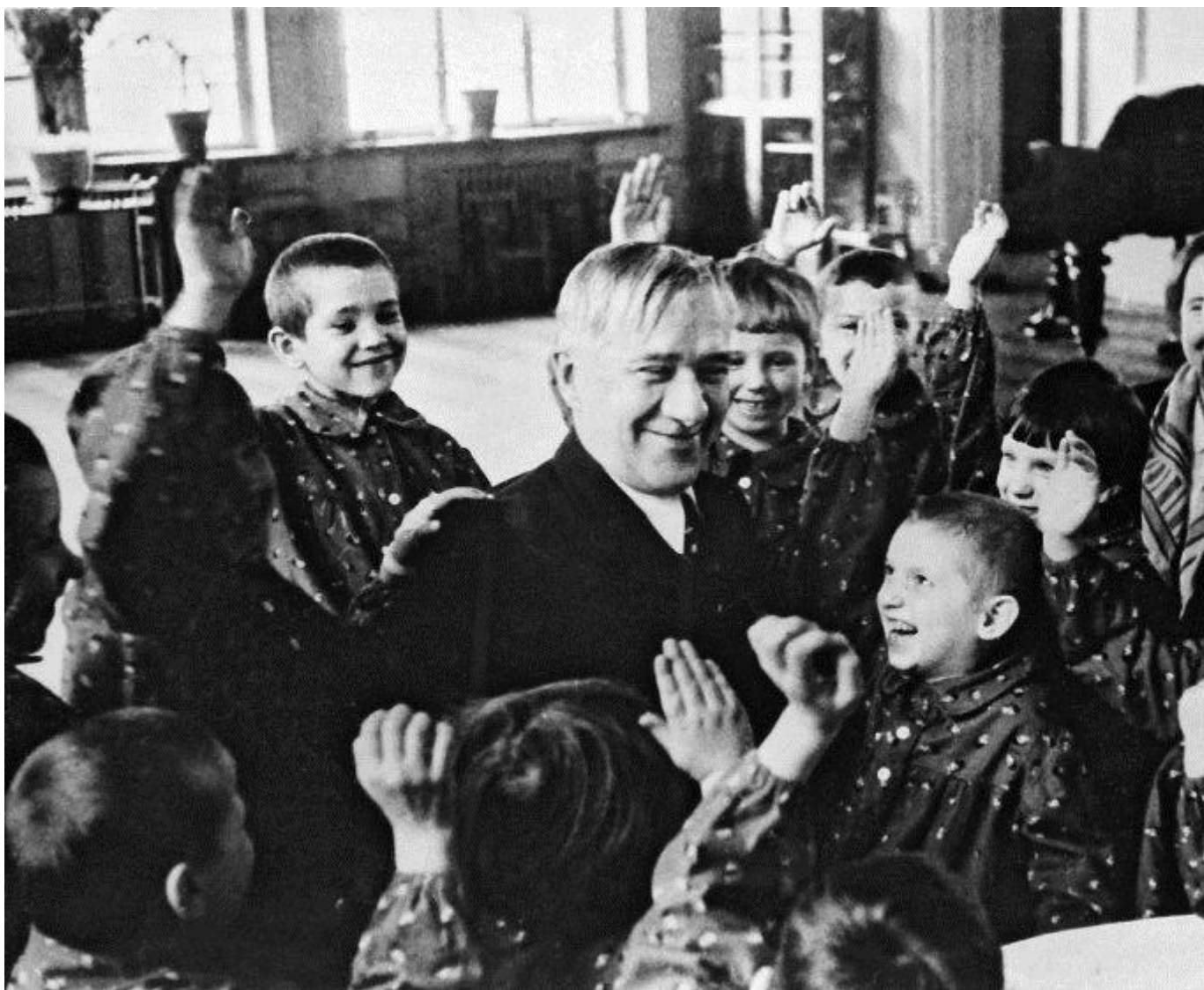
Писатель Корней Иванович Чуковский в детском саду завода «Манометр».