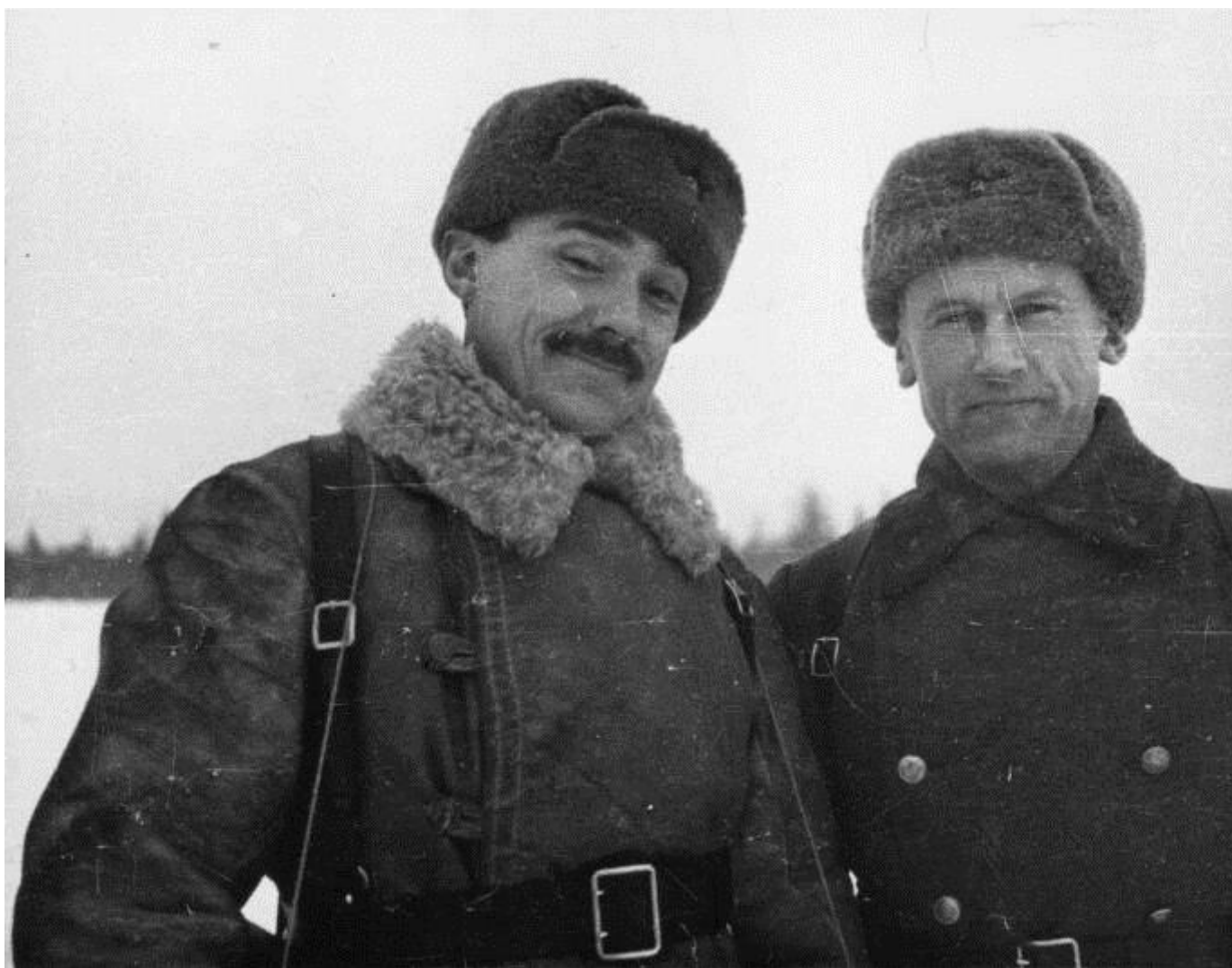
Под Великими Луками. Писатели Сергей Михалков и Александр Фадеев (справа). Сергей Коршунов, январь 1943 года, Псковская обл., г. Великие Луки, МАММ/МДФ.

Школа для взрослых. На уроке русского языка. Неизвестный автор, 1930-е, г. . Миасс, Государственный исторический музей Южного Урала.