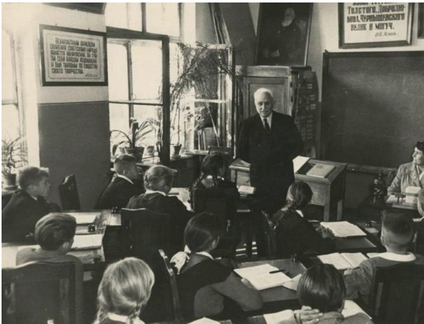
Урок литературы в яснополянской школе им. Л. Н. Толстого. Сергей Васин, 1930-е, МАММ/МДФ.

Выставка «Лицо российского учителя в XX веке» с этой фотографией.